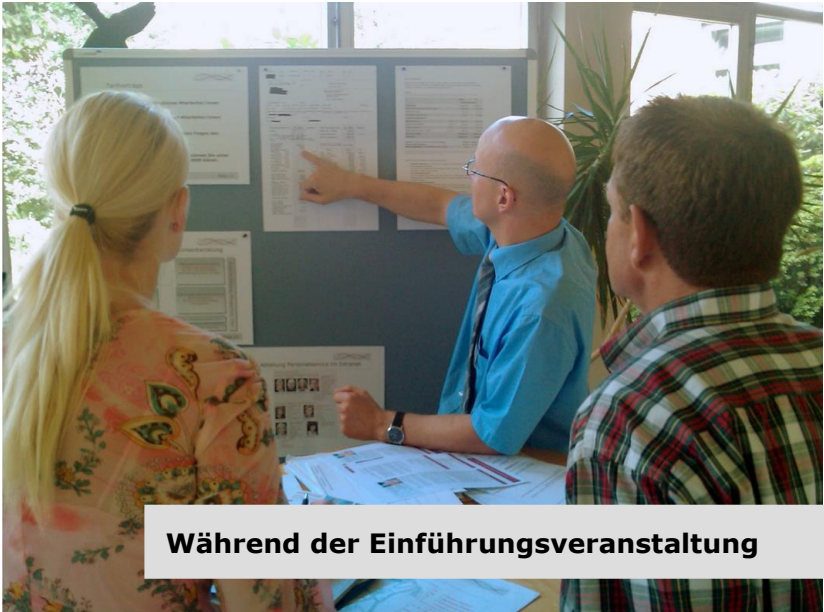
Während der Einführungsveranstaltung

Auf unserer Homepage www.sk-mg.de erhalten Sie einen Gesamtüberblick über die in den Städtischen Kliniken Mönchengladbach möglichen Facharztweiterbildungen.